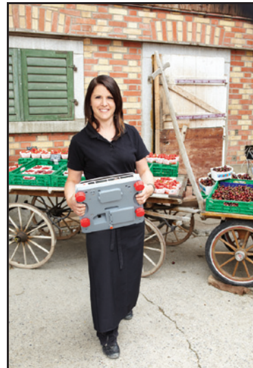
Problemlos zu tragen mit den beiden Griffen seit- lich unten an der Waage.