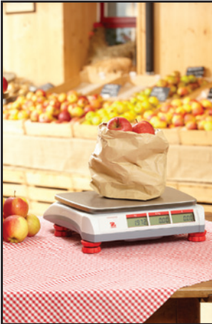
Obst- und Gemüsemärkte

Die Aviator 5000 ist eine elegante, tragbare Handelswaage, die sich für zahlreiche Einsatzgebiete eignet, wie z.B. Wochenmärkte, Verkaufsstände oder kleinere Fachgeschäfte. Mit ihrem geringen Gewicht, der robusten Konstruktion und der hochwertigen Edelstahlwägeplatte eignet sie sich perfekt für Umgebungen, in denen Lebensmittelhygiene, Tragbarkeit und Robustheit unverzichtbar sind. Zusammen mit der hochwertigen Wägetechnologie ist die Aviator eine Investition in Langlebigkeit und Zuverlässigkeit. Die Arbeit mit der Waage geht schnell und mühelos von der Hand - dank ergonomischer Tastatur und bedienungsfreundlicher Benutzeroberfläche bedienen Sie Ihre Kunden bei allen Anwendungen deutlich schneller.