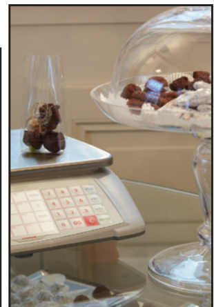
Konfekt, Tee, Schokolade