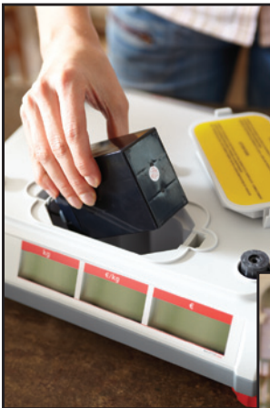
Netzunabhängiger Betrieb dank wiederaufladbarer Akku